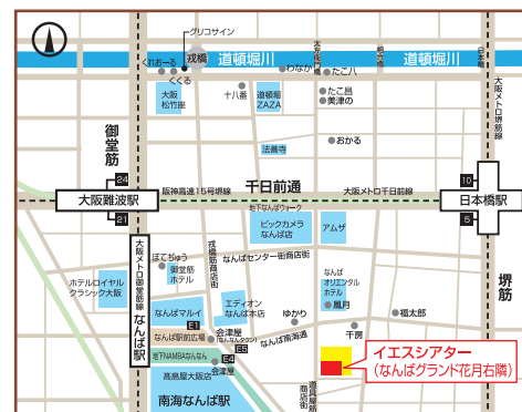
「鉄板会議2024」全国大会 会場マップ