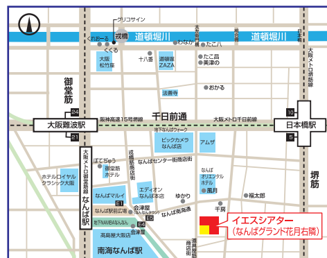
「鉄板会議2023」全国大会 会場マップ